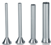
Funnels s/s ø 13-16-20-38 optionals