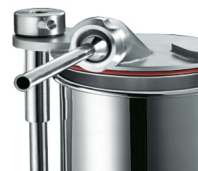
Bush in stainless steel, optional