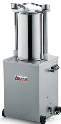
Sirman Шприцы колбасные , model IS 25 Idra :

Sirman Spa Viale dell'Industria 9/11 35010 PIEVE DI CURTAROLO (PD), Italy Tel./Fax. +39 049 9698666 / +39 049 9698688 email: info@sirman.com