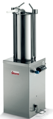
Sirman Шприцы колбасные , model IS 15 Idra :

Sirman Spa Viale dell'Industria 9/11 35010 PIEVE DI CURTAROLO (PD), Italy Tel./Fax. +39 049 9698666 / +39 049 9698688 email: info@sirman.com