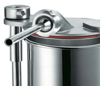
Optional s/s bush, optional