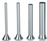
Funnels in s/s ø 13-16-20-38 optionals